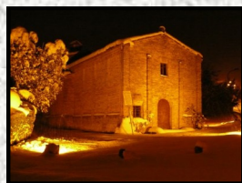
CHIESA DELLA MADONNA DELLA MISERICORDIA O DEL CROCIFISSO (Secoli XV-XVI)