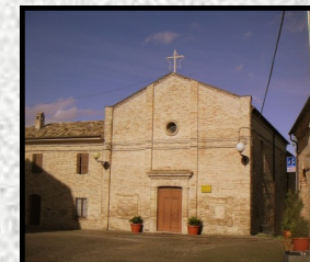
CHIESA PARROCCHIALE DI SAN MARONE (Secoli XV-XVI)