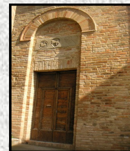
CHIESA DI SAN GIOVANNI BATTISTA (Secolo XII)