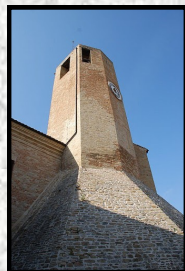
TORRE FARFENSE (Secolo XI)

IL BORGO IDEALE DOVE LA STORIA, LA CULTURA E LA NATURA SI INCONTRANO ARMONIOSAMENTE NELLE CARATTERISTICHE VIE DI PIETRA, DALLE QUALI SI POSSONO AMMIRARE SCORCI SUL PAESAGGIO FERMANO